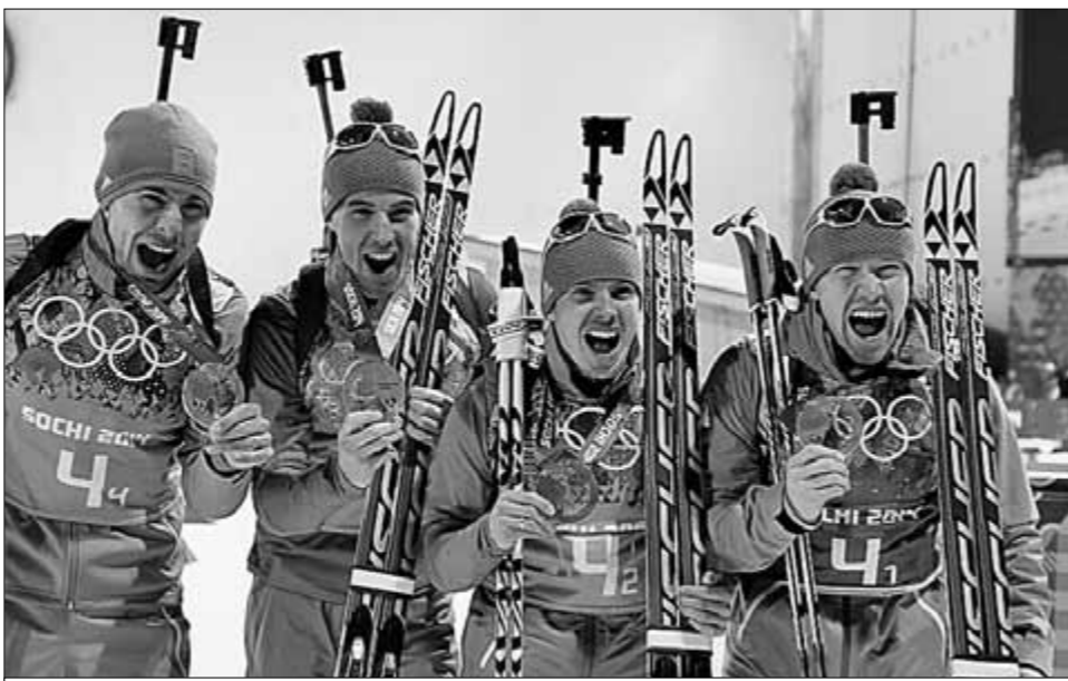
● Они стали победителями биатлонной эстафеты 4x7,5 км — Алексей Волков, Евгений Устюгов, Дмитрий Малышко, Антон Шипулин.

Посмотреть гонку и выступление сына приехали мама с отцом. Но парень, выкладываясь! В спринте-то он промахнулся. Как будет теперь? У Антона получится.