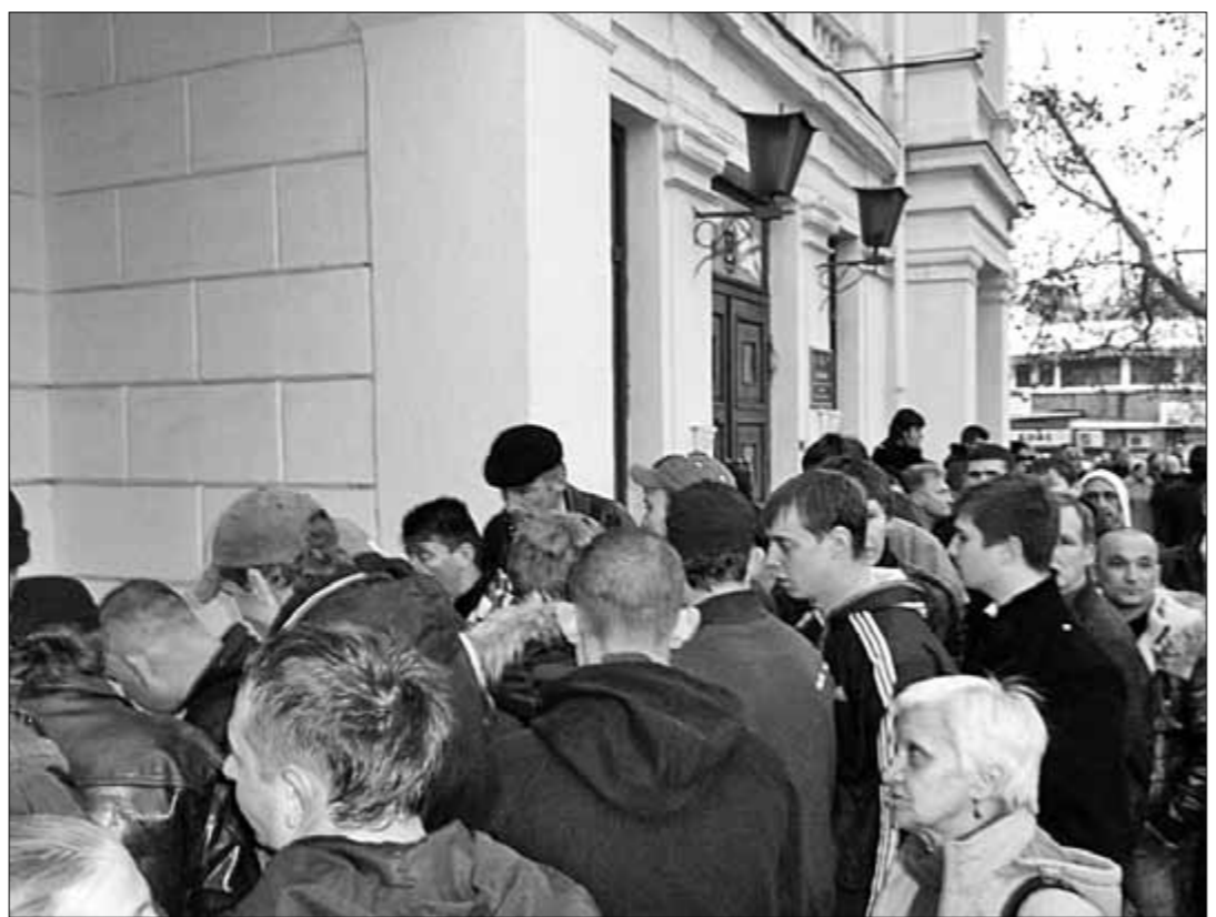
Запись в отряды самообороны в Ялте.

В ДРУГИХ ГОРОДАХ ПОЛУОСТРОВА население тоже решило бороться за свою землю. У нас нет счетов в зарубежных банках и vill в Лазурном Берегу Франции. Нам отступать некуда! Это наша земля! Если предадут местные чиновники, крымчане найдут в себе мужество перейти на нелегальное положение, вспомнив подвиги героических предков — партизан, героев Аджимушкая, защитников Севастополя, керченско-феодосийского десанта и многих других. У бандеровской сволочи земля будет гореть под ногами! И это не красивые словеса! Так, на днях жители города-героя Керчь разогнали митинг «евромайданов» и показали: им не по пути с фашистами.