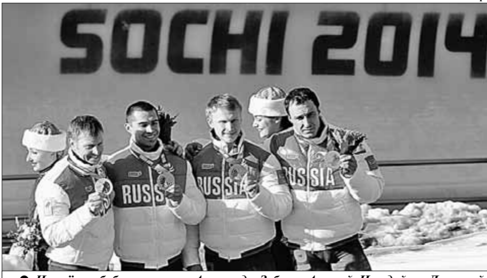
● Четвёрка бобслеистов — Александр Зубков, Алексей Негодайло, Дмитрий Труненков и Алексей Воевода выиграли олимпийские золотые медали.

Тут другое интересно: как он за короткое время преодолел прежнее неудачу в спринте, которая любого может выбить из седла? Может, сыграла сплочённость команды? Ценный козырь русского спортсмена — коллективизм. И страна задавала простым вопросом: сколько же биатлонистам ещё проигрывать, чтобы обрести наконец себя?