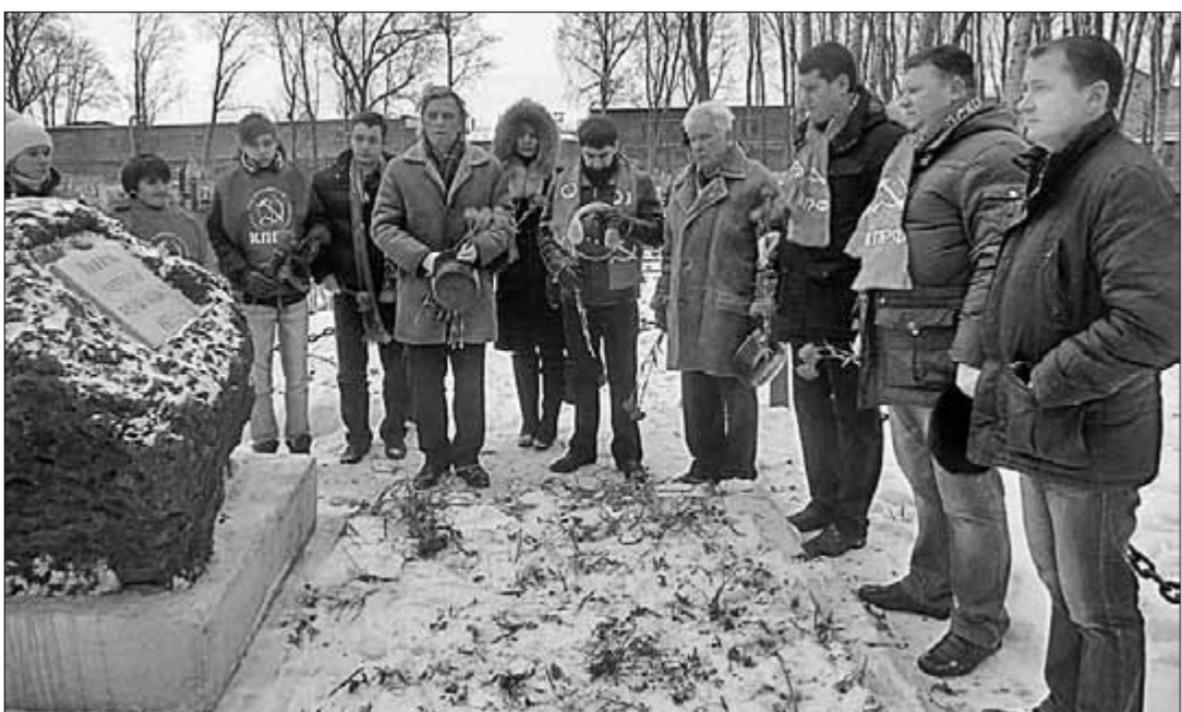
9 января тульские коммунисты возложили цветы к памятнику жертв трагических событий января 1905 года.