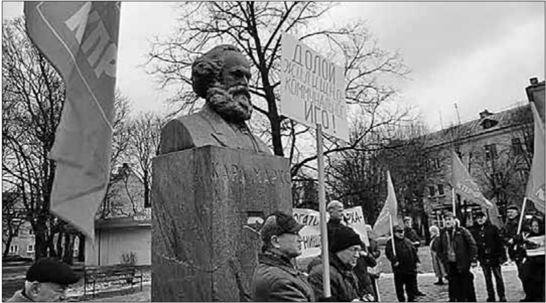
Калининградские коммунисты провели 9 января митинг на тему «Кризис 1905-го и кризис 2015-го. Как выйти из потрясений, не потеряв страну и народ?»