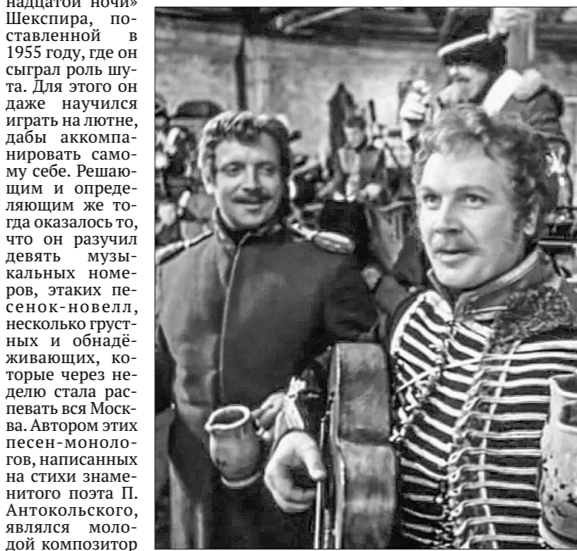
□ Кадр из фильма «Гусарская баллада». 1962 г.

«Отчего, почему» А. Эшпая на слова В. Котова (из кинофильма «Повесть о первой любви»); «Я сказал тебе не все слова» А. Эшпая на слова В. Карпенко; «Талисман» Е. Жарковского на слова М. Танича (из кинофильма «Потрясающая тишина»); «Вторая молодость» А. Морозова на слова М. Рябинина; «Ты рядом со мной» Б. Мокроусова на слова Н. Глейзарова (из кинофильма «Наши соседи»); «Старая планетка» Ю. Левитина на слова М. Матусовского; «Наша биография» В. Шаинского на слова В. Харитонова; «На звёздных дорогах» З. Левиной на слова Ю. Каменецкого; «Камчатка» А. Пахмутовой на слова С. Гребенникова и Н. До-