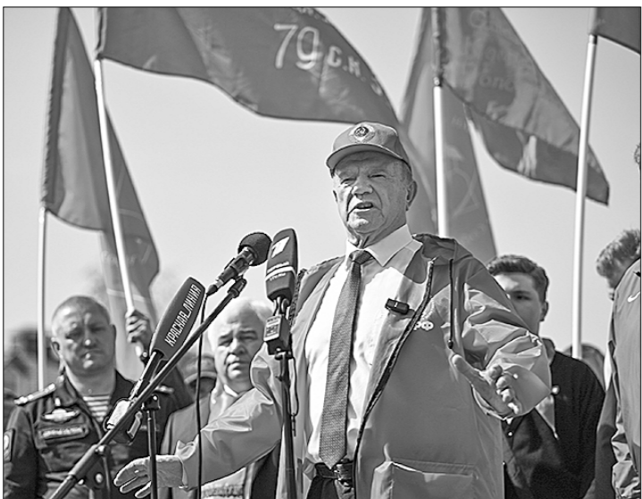
14 мая с площадки совхоза имени Ленина отправился очередной, 154-й гуманитарный конвой КПРФ. В мероприятии принял участие Председатель ЦК КПРФ Г.А. Зюганов, который выступил перед собравшимися.