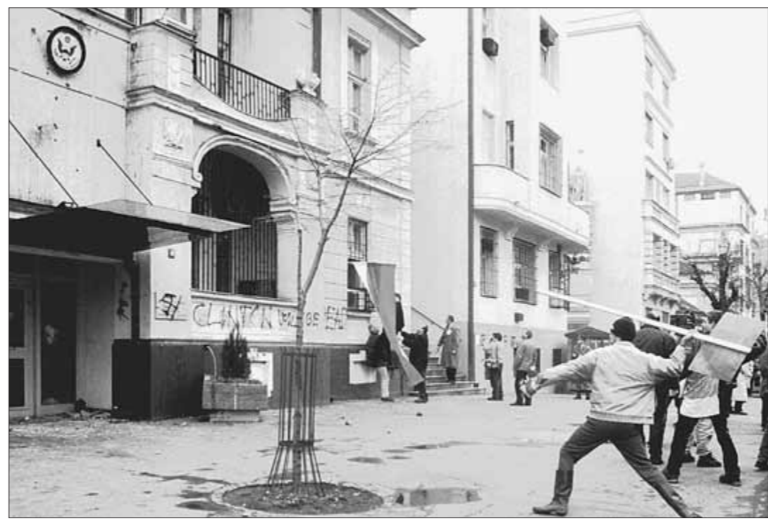
● Молодежь Белграда крушит здание американского посольства.

Замысел «лидера», инициатора и вдохновителя агрессии —