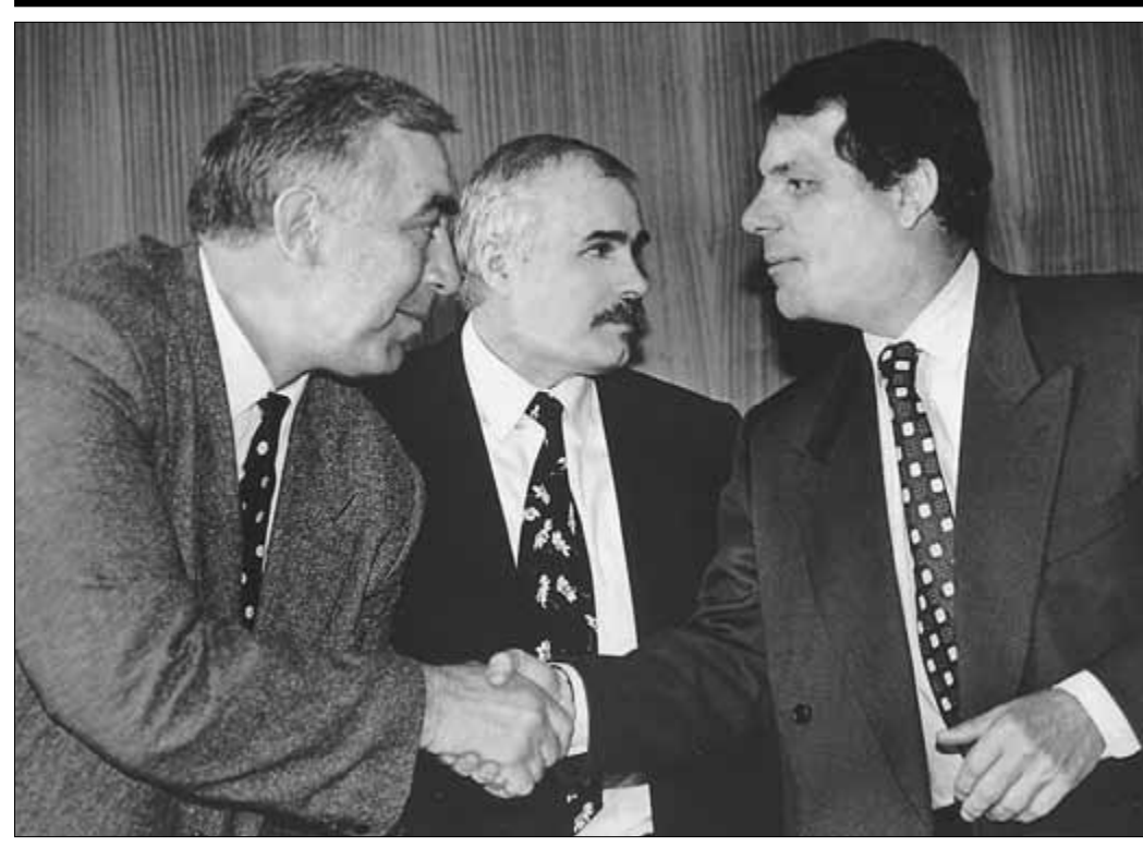
Газета «Файнэншл таймс» сообщила о достигнутом наконец прорыве в финансировании грандиозного проекта по сооружению нового нефтепровода, который должен будет соединить казахские нефтяные месторождения с Новороссийским портом.

Консорциум в составе французской строительной компании и двух российских — «Кубаньнефтегазстрой» и «Ставропольнефтегазстрой» получили от транснационального консорциума, главные акционеры в котором являются американские компании «Шеврон» и «Мобил», контракт на