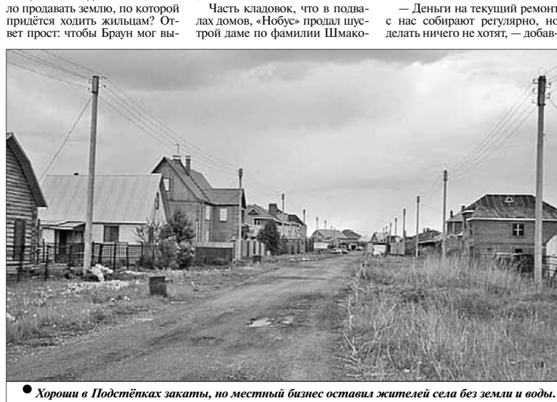
Хороши в Подстёпках закаты, но местный бизнес оставил жителей села без земли и воды.